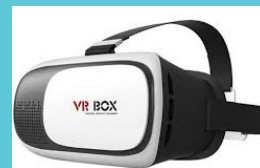
[사진]개인용 VR Box w/ 스마트폰