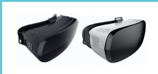
[사진]그룹용 스마트폰이 필요없는 uVR 헤드세트 (Emerald VR)